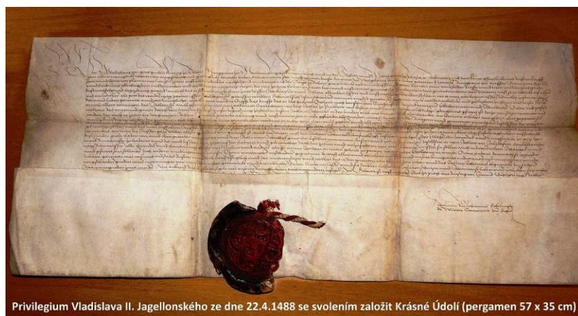
Privilegium Vladislava II. Jagellonského ze dne 22.4.1488 se svolením založit Krásné Údolí (pergamen 57 x 35 cm)